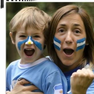
גם אצל הורים וילדים