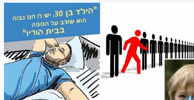
תלות - יוזמה